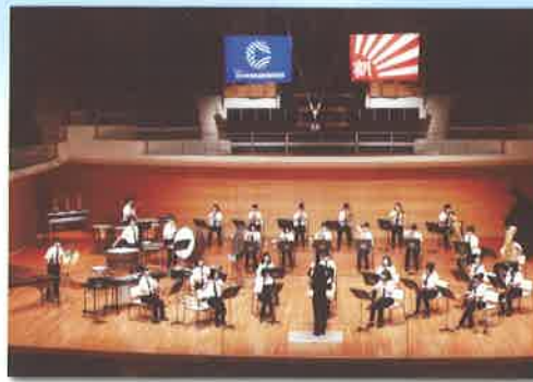
【吹奏楽部】・西関東吹奏楽コンクール 銀賞