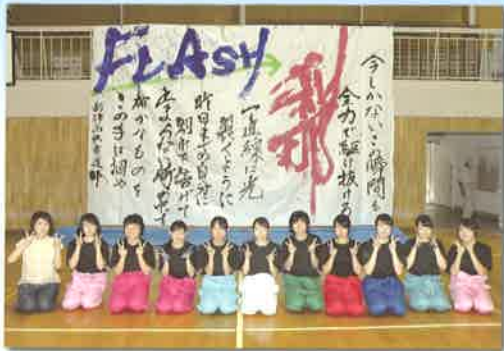
【書道部】・全国高等学校総文祭 県代表