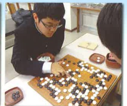
【囲碁将棋部】 ・全国高等学校総文祭 県代表