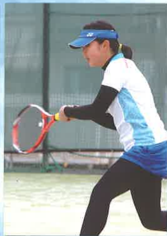
【テニス部】 ・北信越高校総体 団体出場