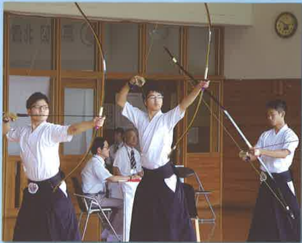
【弓道部】・インターハイ出場 ・全国高校選抜大会出場