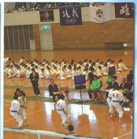
【少林寺拳法部】 ・全国選抜大会出場