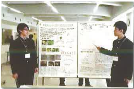
【理科部】 ・日本生態学会高校生ポスター発表 審査員特別賞