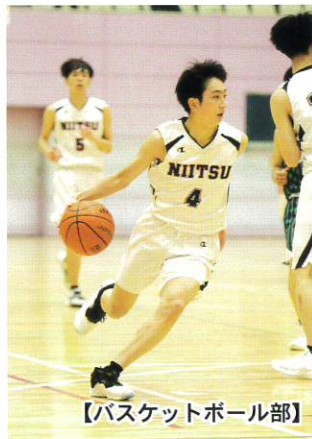
【バスケットボール部】